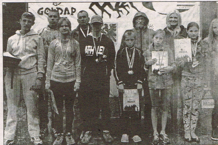
Delegacja sportowców z Wileńszczyzny z organizatorami zawodów w Gołdapi